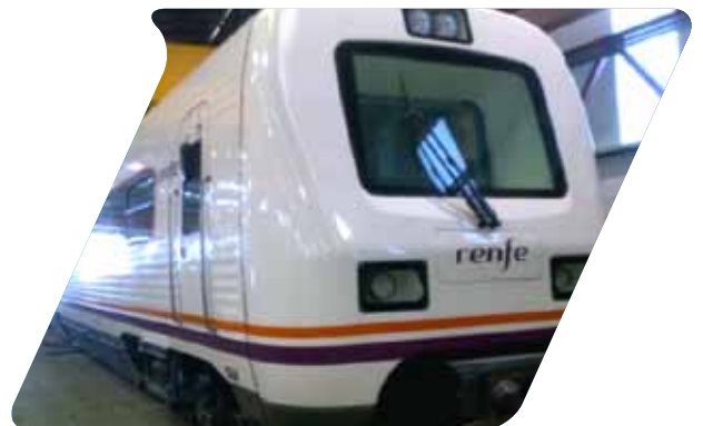
Tren Regional Diesel - RENFE. Puesta a Cero, Revisión General y Restyling.

Construcción y adaptación de vehículos auxiliares Reparación de Accidentes.