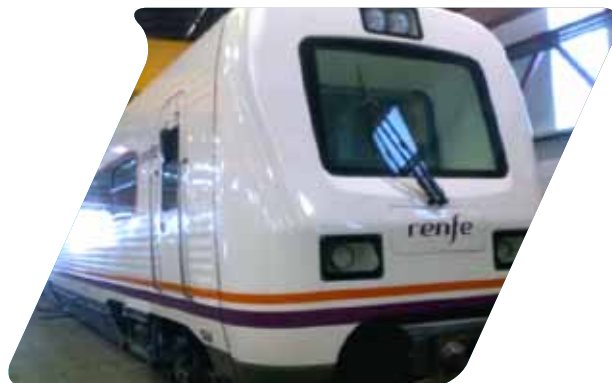
Treno regionale Diesel - RENFE. Messa a punto, revisione generale e restyling.

Costruzione e adattamento di veicoli ausiliari Riparazione successiva ad incidenti.